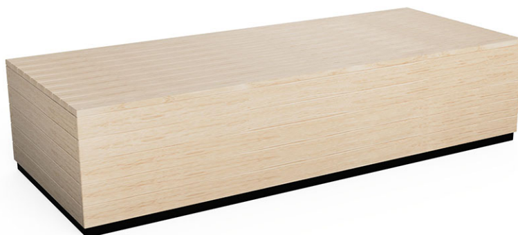
Plate-forme de jeu en mélèze suisse brut, 250 x 100 cm, hauteur de la plate-forme 58 cm, profondeur de montage minimale 50 cm.